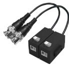
PFM800-E Symétriseur HDCVI passif